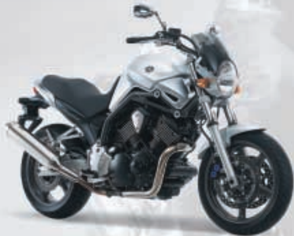
METALLIC SILVER (SM1)