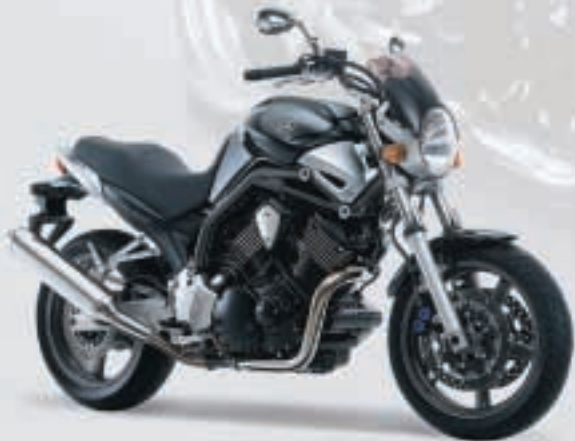
MIDNIGHT BLACK (BL2)